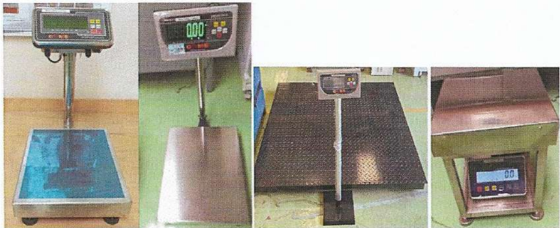
Figure 2: GMS Platform Scale, GMS Bench Scale and GMS Floor Scale